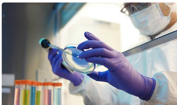
COVID-19 - Essais cliniques en cours